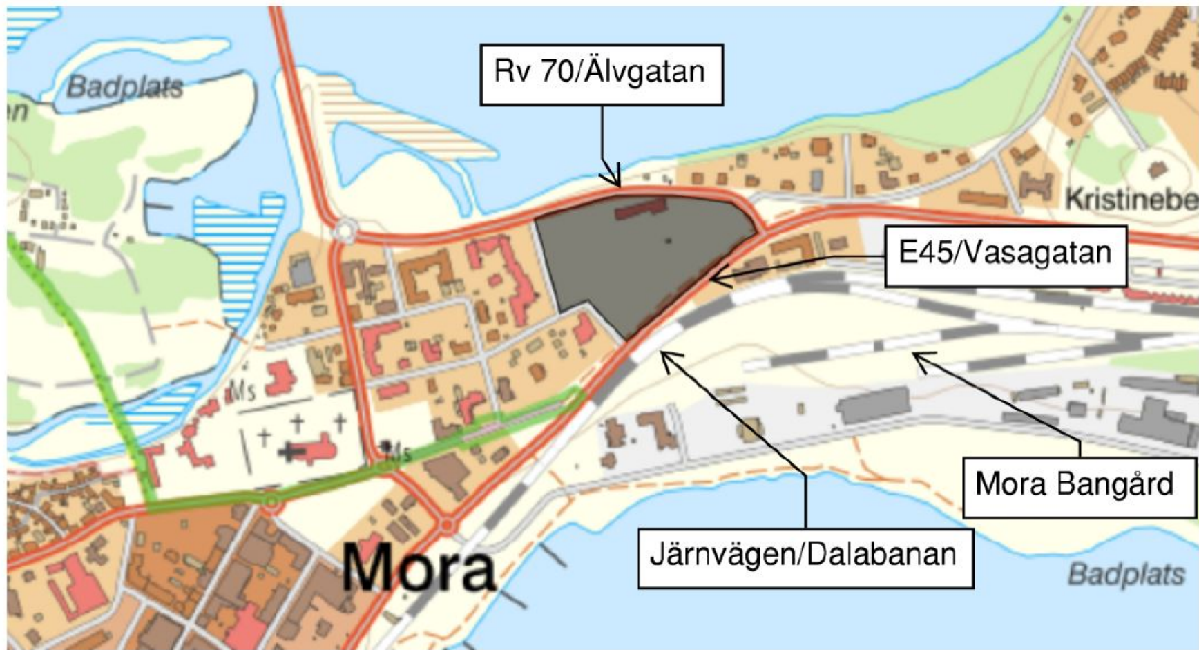
Figur 3.1. Riskkällor i förhållande till det studerade området.